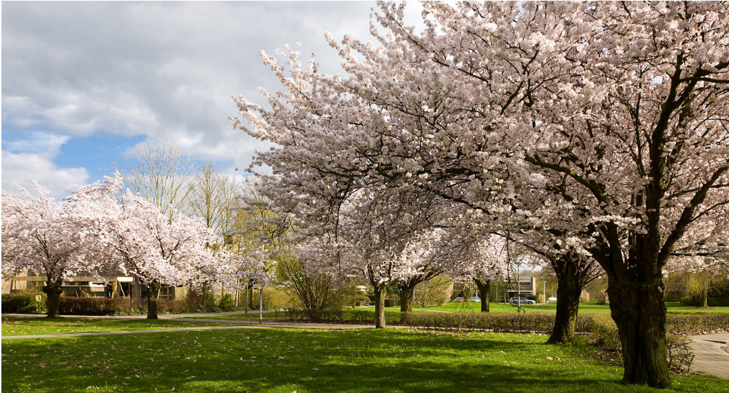
Afbeelding 1: Beeldbepalende Kersenlaan