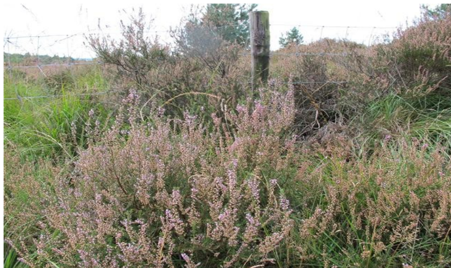
Foto 1: struikheide op de Heumense schans. Het hek is 1 meter hoog en de heidestruiken dus ook. Voor het begrip: dit zijn dus geen kleine plantjes