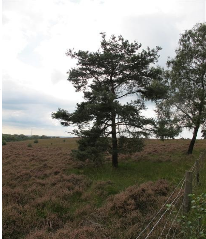
Foto 3: Grove dennen op Heumense schans vergelijkbaar aan die in de vennen.

Deze solitaire Grove den staat ook op de Heumense schans. Zoals je ziet heeft een enkele Grove den van een jaar of 10-15 een reikwijdte met zijn takken van een heide-plant of 6 a 12. Onder de Den groeit geen heide maar gras, dus het is goed te zien hoe ver zijn takken reiken.